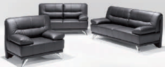
Echt Leder 3-2-1