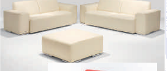
Echt Dickleder 3-2