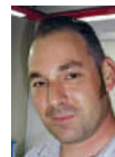
Yves Mathis Carrosserie