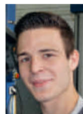
Christoph Bischof Technik