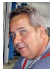
René Lauper Technik