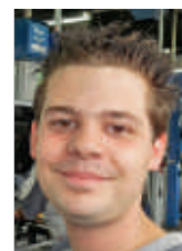
Ronny Bauer Technik