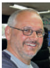
Robert Inhelder Technik